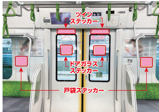
掲載イメージ (山手線 E235 系)